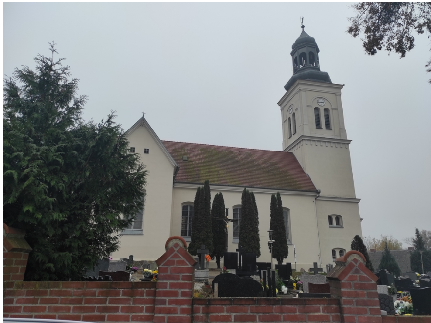
Ryc. 8 Kościół pw. św. Michała Archanioła we Wtelnie