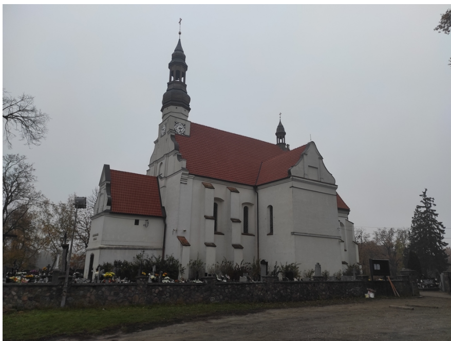
Ryc. 6 Kościół pw. św. Trójcy w Byszewie

Zespół kościoła parafialnego: kościół pw. Świętej Trójcy, cmentarz przykościelny z 2 poł. XVII – 1 poł. XIX w, dzwonnica i brama z ogrodzeniem, z XVIII/XIX w., spichlerz plebański, drewniany, z koń. XVIII wieku. Kościół z ok. 1651 r., rozbudowany z wcześniejszego z XV lub XVI w. przez opata koronowskiego Jana K. Czołchańskiego. Przebudowany w 2 poł. XVIII w. m. in. przez dodanie kaplic, założenie sklepień w nawie i hełmu na wieży. Manierystyczny, w tradycjach gotyckich, z elementami barokowymi oraz z bogatym rokokowo-barokowym wystrojem wnętrza i wyposażeniem.