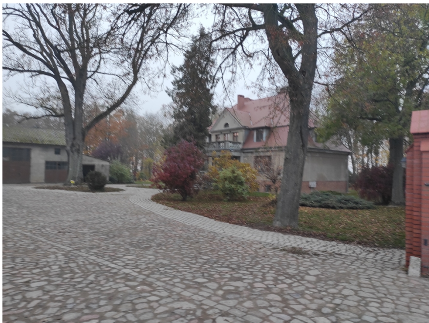
Ryc. 10 Dwór i park w Gościeradzu (Wyczółkowo)

Gościeradz – zespół dworsko-parkowy (wpisany do rejestru zabytków): dwór zbudowany w latach 1931-34 dla malarza Leona Wyczółkowskiego. Murowany, otynkowany, parterowy, nakryty dachem mansardowym, z gankiem od frontu. Do dworu przylega park z okazami starodrzewu, z 2 poł. XIX wieku. Na południe od dworu zabudowania folwarczne.