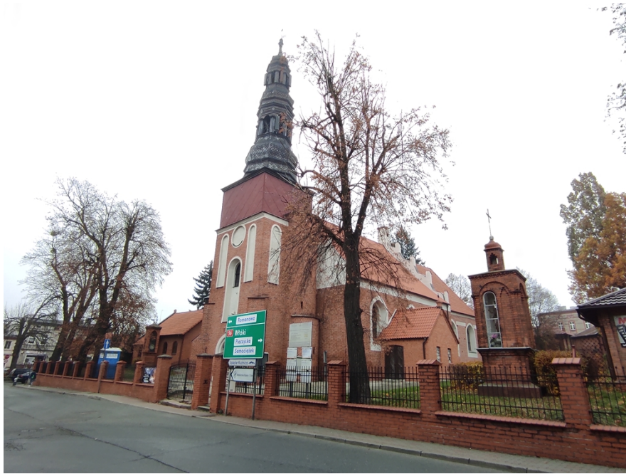
Ryc. 4 Kościół pw. św. Andrzeja w Koronowie

Synagoga (ul. Szkolna nr 6), zbudowana w 1856 r. (od 1938 r siedziba Towarzystwa Gimnastycznego „Sokół”). Po II wojnie światowej mieściło się tu kino Brda. W 2000 r. budynek przejęła gmina Koronowo, po wyremontowaniu od 2016 r. działa w nim Centrum Kultury Synagoga.