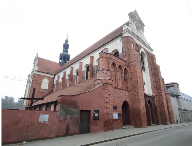
Ryc. 2 Kościół pw. Wniebowzięcia NMP w Koronowie

Kościół parafialny pw. Wniebowzięcia Najświętszej Marii Panny, ul. Bydgoska 23 - bazylika, będąca przykładem monumentalnej architektury wczesnogotyckiej z lat 1289 – 1315, zbarokizowana w koń. XVII i XVIII wieku. Kościół trójnawowy, z zespołem kaplic przy nawach bocznych korpusu, z prezbiterium zamkniętym prostą ścianą. Bogate wnętrze kościoła z gotyckim, gwiaździstym sklepieniem, w nawie głównej barokowe, kolebkowe z lunetami, w nawach bocznych krzyżowe. Kościół posiada bogate, barokowe wyposażenie, w tym obrazy Bartłomieja Strobla i fragmenty polichromii gotyckich. Kościół reprezentuje najwyższy poziom umiejętności cystersów w budownictwie i rzemiośle. Obiekt powstawał etapami, stąd prezentuje trzy style: gotycki, barokowy i rokokowy.