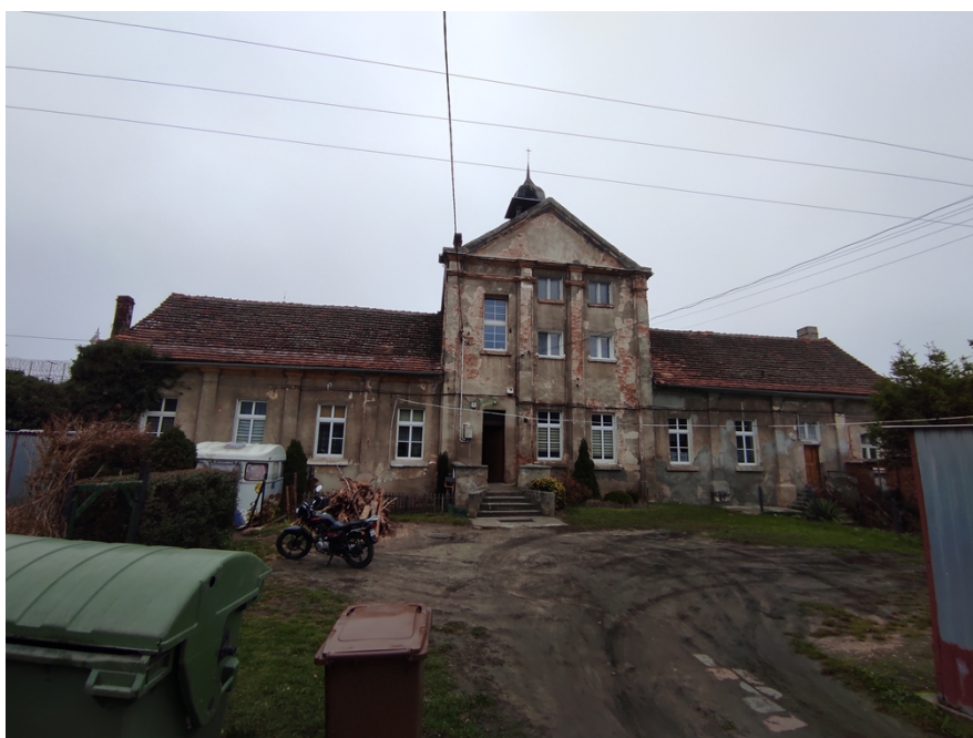
Ryc. 3 Pałac Opata w Koronowie

Pałac Opata (ul. Klasztorna nr 1), dawna rezydencja opata, zbudowana za czasów opata Gnińskiego, na przełomie XVII i XVIII w., barokowa, murowana, otynkowana. Po kasacie zakonu Cystersów, włączona do zespołu więzienia. Obecnie w budynku mieszczą się mieszkania.