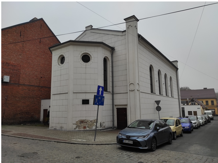
Ryc. 5 Synagoga w Koronowie

Synagoga (ul. Szkolna nr 6), zbudowana w 1856 r. (od 1938 r siedziba Towarzystwa Gimnastycznego „Sokół”). Po II wojnie światowej mieściło się tu kino Brda. W 2000 r. budynek przejęła gmina Koronowo, po wyremontowaniu od 2016 r. działa w nim Centrum Kultury Synagoga.