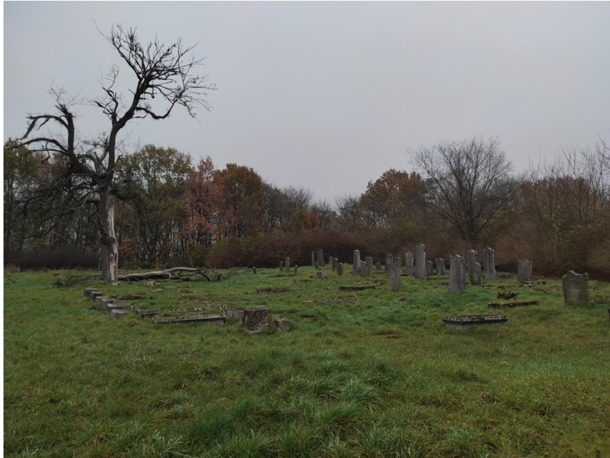
Ryc. 9 Cmentarz żydowski w Koronowie