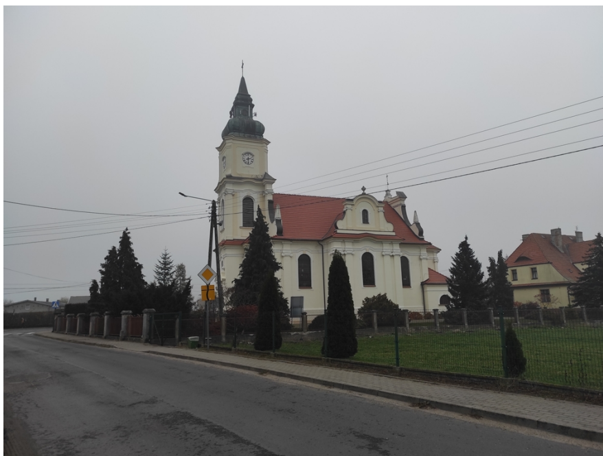
Ryc. 7 Kościół pw. śś. Piotra i Pawła w Wierzchucinie Królewskim

Kościół par. pw. śś. Piotra i Pawła, zbudowany w miejscu wcześniejszego, w latach 1930-31, pseudobarokowy, z rokokowym wystrojem wnętrza. Murowany, otynkowany. W pobliżu kościoła głaz narzutowy (znaleziony w czasie rozbiórki poprzedniej świątyni) z datą 1752 oraz alfą i omegą.