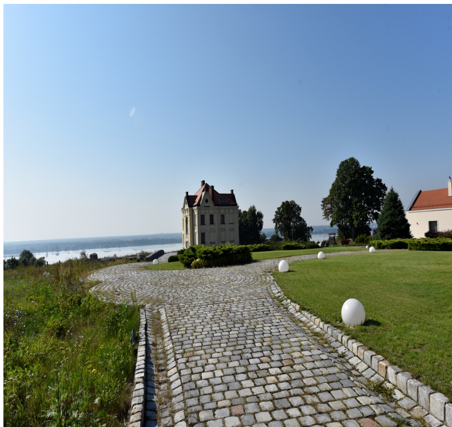
Rysunek 11. Dwór w Zarzeczewie

Obiekt zabytkowy, posiada znaczenie lokalne, a także wartość historyczną ze względu na swój wiek.