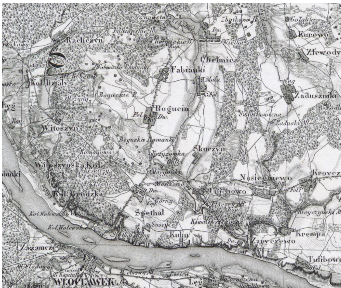
Rysunek 2. Okolice dzisiejszej gminy Fabianki na mapie z 1843 r.

Źródło: Topograficzna karta Królestwa Polskiego wyd. w r. 1843 z datą 1839, oprac. przez Kwatermistrzostwo Generalne W. P. w l. 1822-1831, wykończona przez ros. Korpus Topografów pod kier. gen. Richtera w l. 1832-1843]