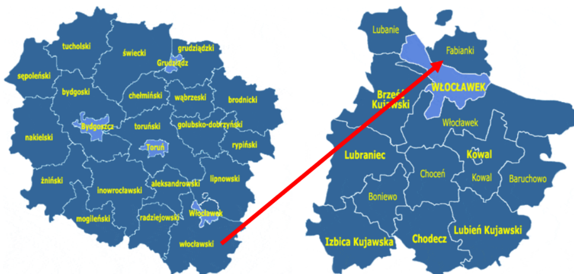
Rysunek 1. Położenie gminy Fabianki na tle województwa kujawsko-pomorskiego i powiatu włocławskiego