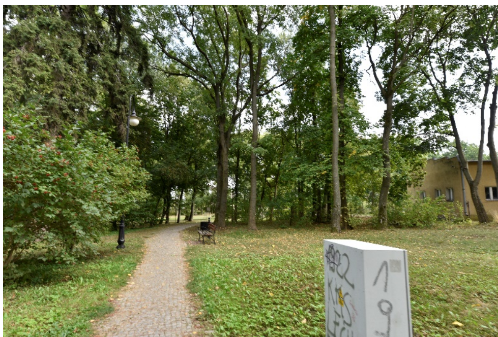
Rysunek 10. Park dworski w Szpetalu Górnym

Pierwotnie założenie obejmowało tereny między obecnymi ulicami Włocławską, Lipową, Parkową i Klonową. Północną granicę stanowiły sady owocowe oraz staw. Ośią kompozycyjną była dzisiejsza ulica Szkolna prowadząca od Kościoła do obecnego budynku szkoły, dawniej dworu. Obecnie znaczna część założenia parkowego uległa parcelizacji i zmianie funkcji. Na terenie założenia zburzono dawne zabudowania folwarczne, a w ich miejsce wzniesiono nowe budynki użyteczności publicznej i budynki mieszkalne. Dodatkowo w latach powojennych wycięto znaczną część drzew, co spowodowało zatarciu i degradacji całego założenia.