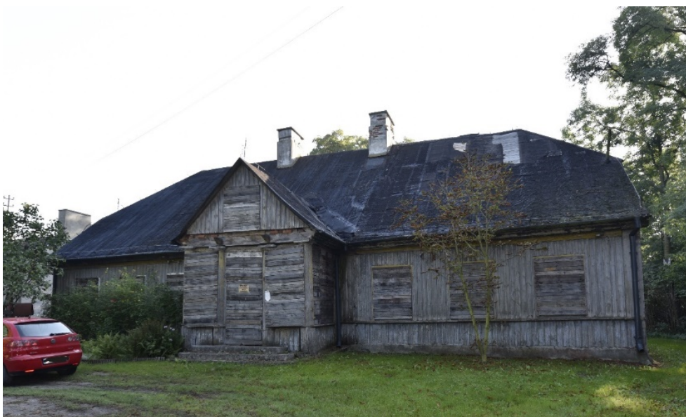
Rysunek 8. Dwór w zespole dworsko-parkowym w Nasiegniewie

Zespół posiada znaczenie lokalne, a także wartość historyczną ze względu na swój wiek oraz wartość estetyczną ze względu na wkład w krajobraz i przestrzeń publiczną.