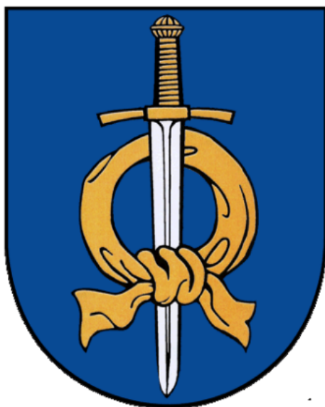
Rysunek 3. Herb i flaga gminy Fabianki

Herb Gminy Fabianki przedstawia w polu niebieskim tarczę typu gotyckiego, złotą chustę (nałęcz) w krąg związaną końcami ku dołowi i przeszytą w słup mieczem srebrnym o złotej rękojeści. 8