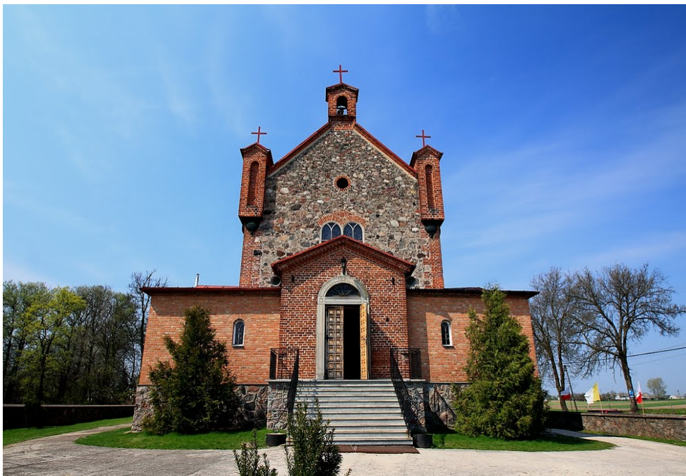
Kościół parafialny pw. MB Szkaplerznej.