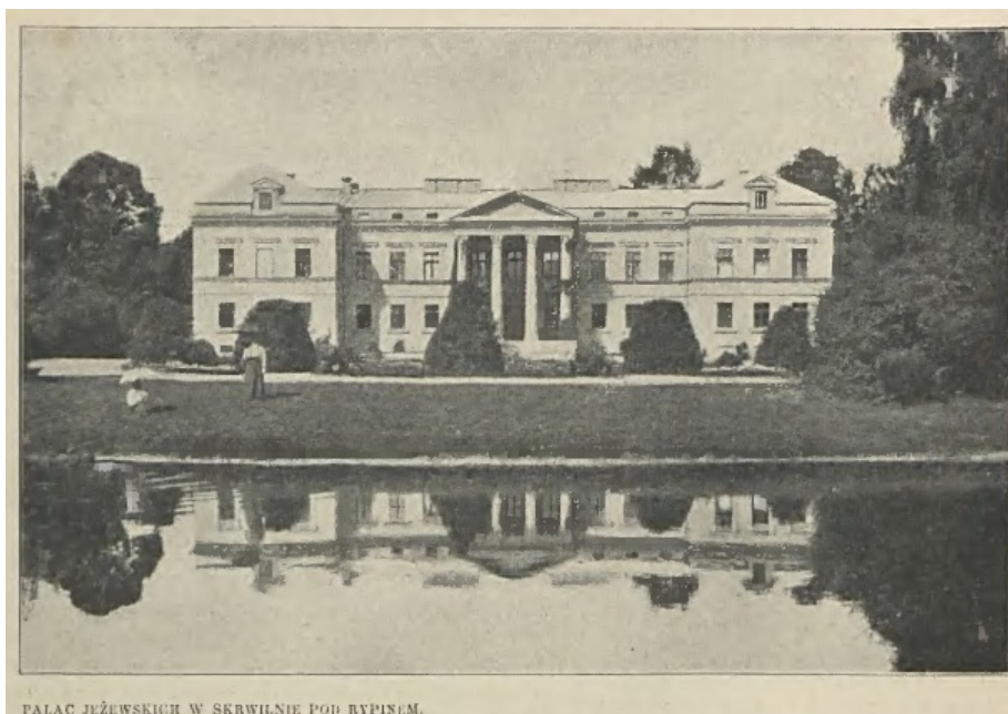
PALAC JEŻEWSKICH W SKRWILNIE POD RYPINEM.