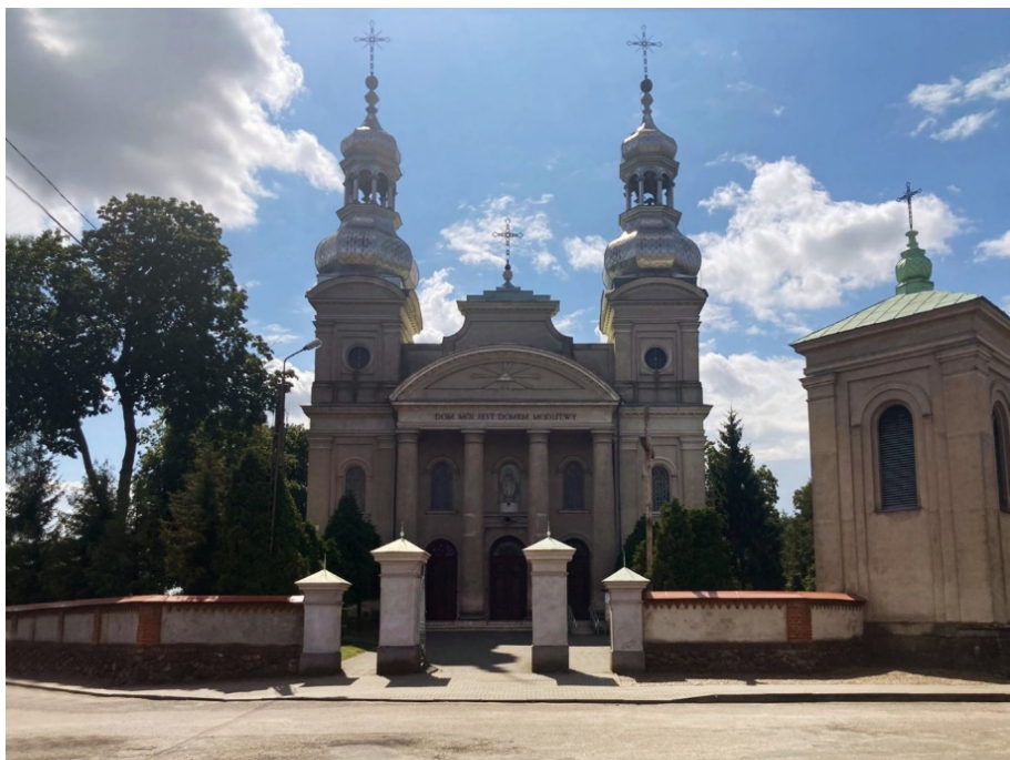
Kościół parafialny rzymskokatolicki pw. Wszystkich Świętych i Wniebowzięcia NMP w Skrwilnie