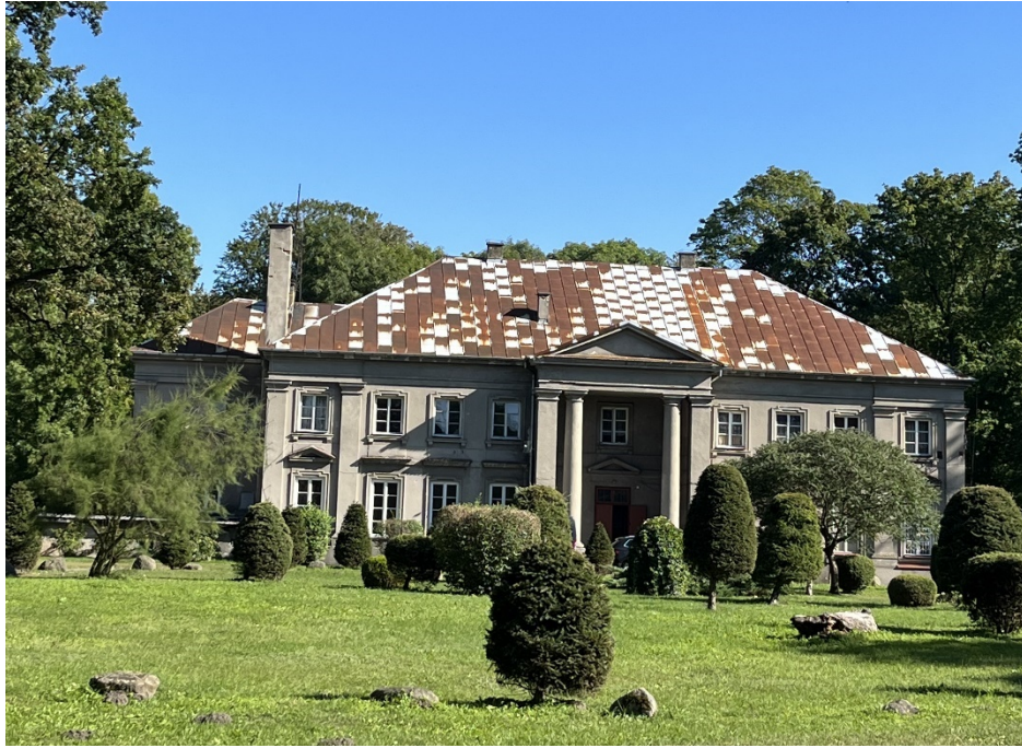
Pałac w Okalewie