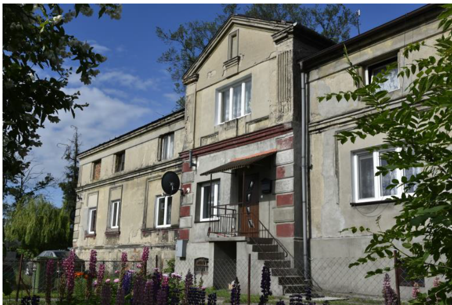
Rysunek 13. Dwór w Czołówku