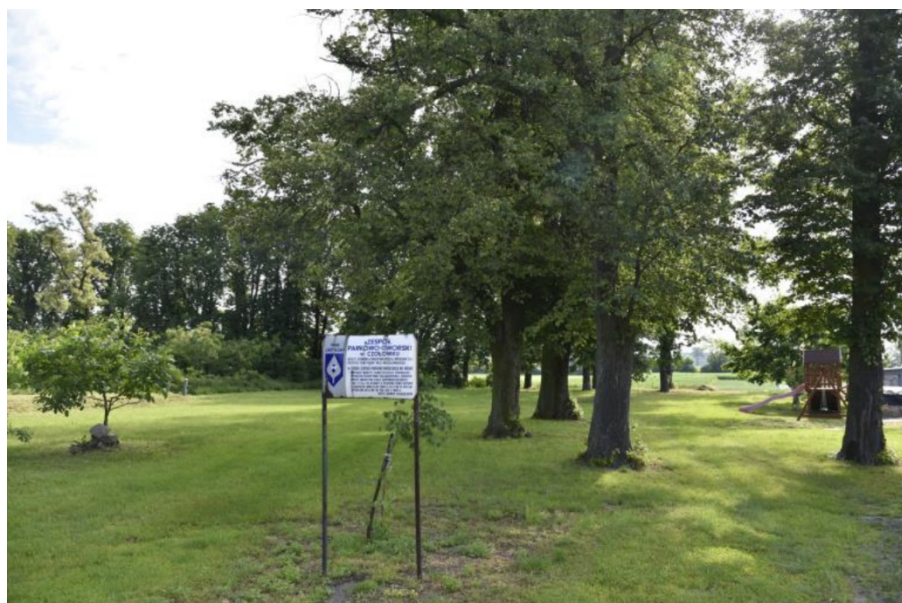
Rysunek 14. Park dworski w Czołówku

Park podworski powstał po roku 1867, kiedy to rodzina Gruetzmacher kupiła majątek Czołówkę liczący 12 włók ziemi, i postanowiła założyć obecny park wokół zrujnowanego drewniano-murowanego dworku. Po II wojnie światowej park został zniszczony przez miejscową ludność. Większość drzew została wtedy całkowicie wycięta. Obecnie zachowała się jedynie część południowo-zachodnia parku – pierwotna granica biegła w części północnej i wschodniej wzdłuż obecnie zachowanych alei drzew i obejmowała również pobliski staw. Z dawnego założenia pozostała jedynie aleja kasztanowa oraz starodrzew.