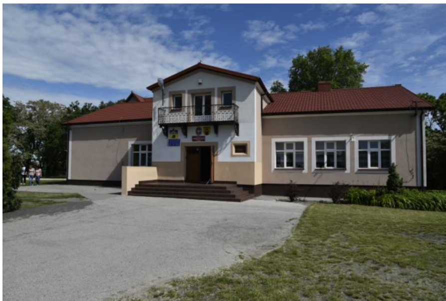
Rysunek 17. Dwór w Skibinie

rozcłonkowana, poszczególne człony nakryte osobnymi dachami (dwuspadowymi). Od strony zachodniej do bryły przylega prostokątna oficyna, natomiast po stronie wschodniej przylega dobudowane skrzydło w kształcie litery „L”. W elewacji południowej piętrowy ryzalit z balkonem wspartym na konsolkach, kryty dachem dwuspadowym. Wystrój dekoracyjny ścian w tynku w postaci gzymsu podokapowego.