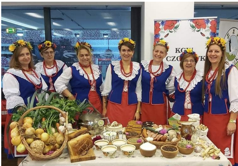
Rysunek 7. Koło Gospodyń Wiejskich Czołówek w tradycyjnym stroju kujawskim