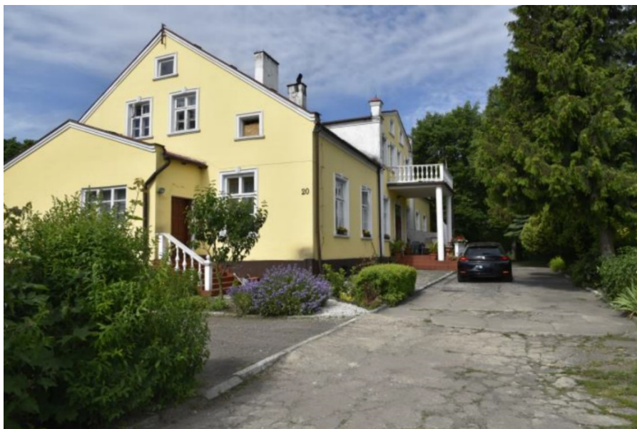
Rysunek 9. Dwór w Biskupicach (obecnie Rodzinny Dom Dziecka)

przeprowadzono gruntowny remont z adaptacją na cele biurowe. Ostatecznie umieszczono w nim Rodzinny Dom Dziecka, który funkcjonuje obecnie.