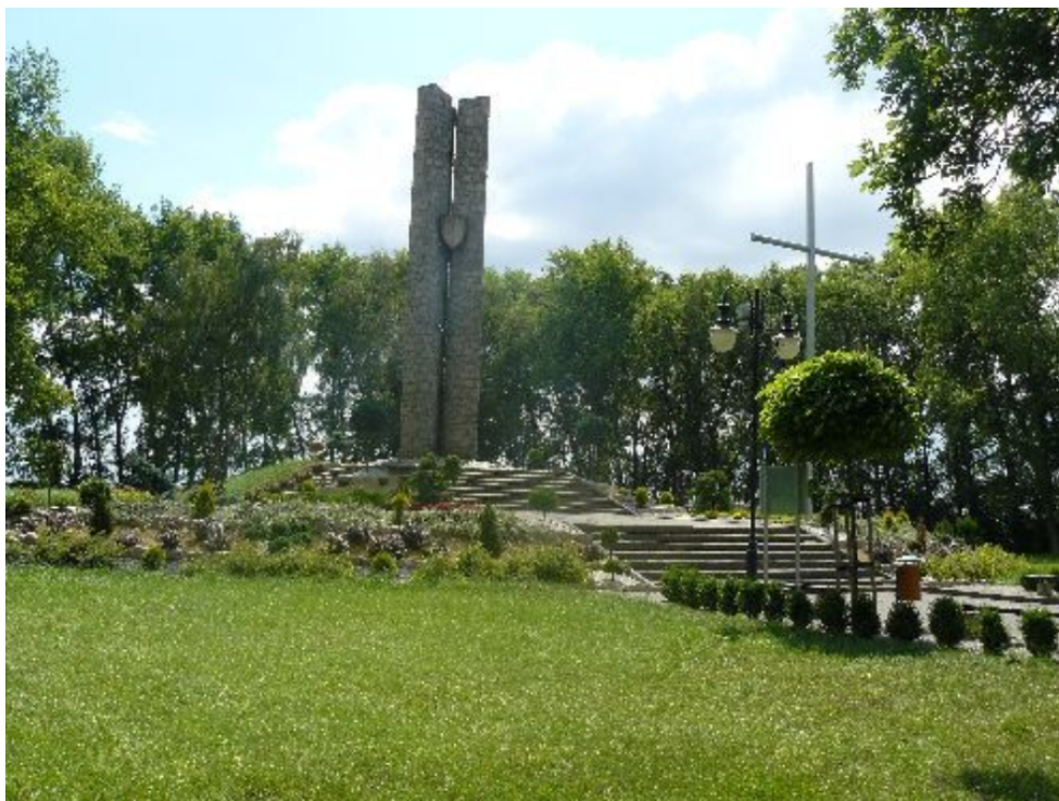
Rysunek 4. Pomnik i kopiec upamiętniający bitwę pod Płowcami