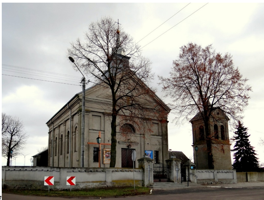
Rysunek 11. Kościół parafialny pw. Św. Wojciecha wraz z dzwonnica i ogrodzeniem w Broniewie