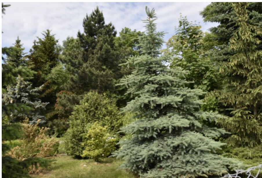
Rysunek 10. Park podworski w Biskupicach