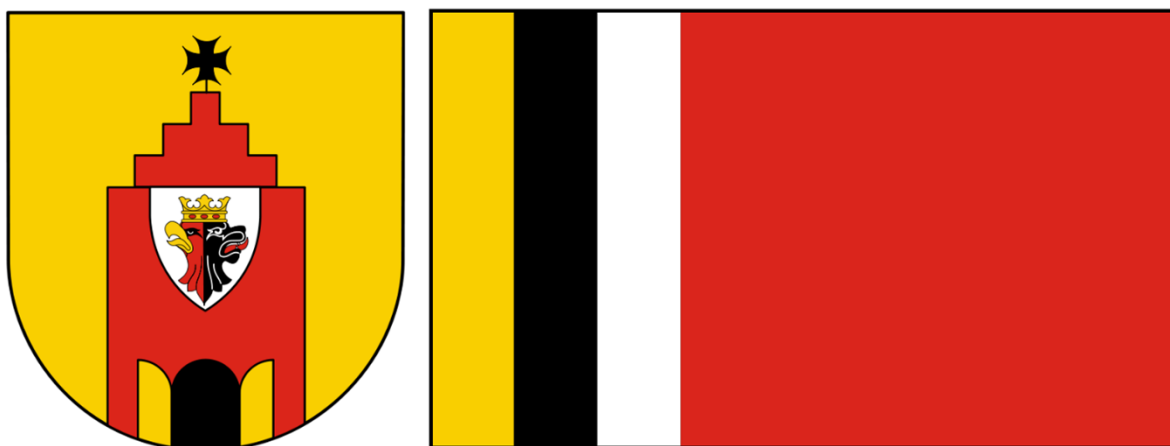
Rysunek 3. Herb i flaga gminy Radziejów

Flagę Gminy stanowi natomiast poziomy płat złożony z czterech pionowych stref barwnych, kolejno od lewej w kolorach żółtym, czarnym, białym i czerwonym, z czego strefy żółta, czarna i biała, równej szerokości, zajmują jedną trzecią szerokości płata, a strefa czerwona dwie trzecie.