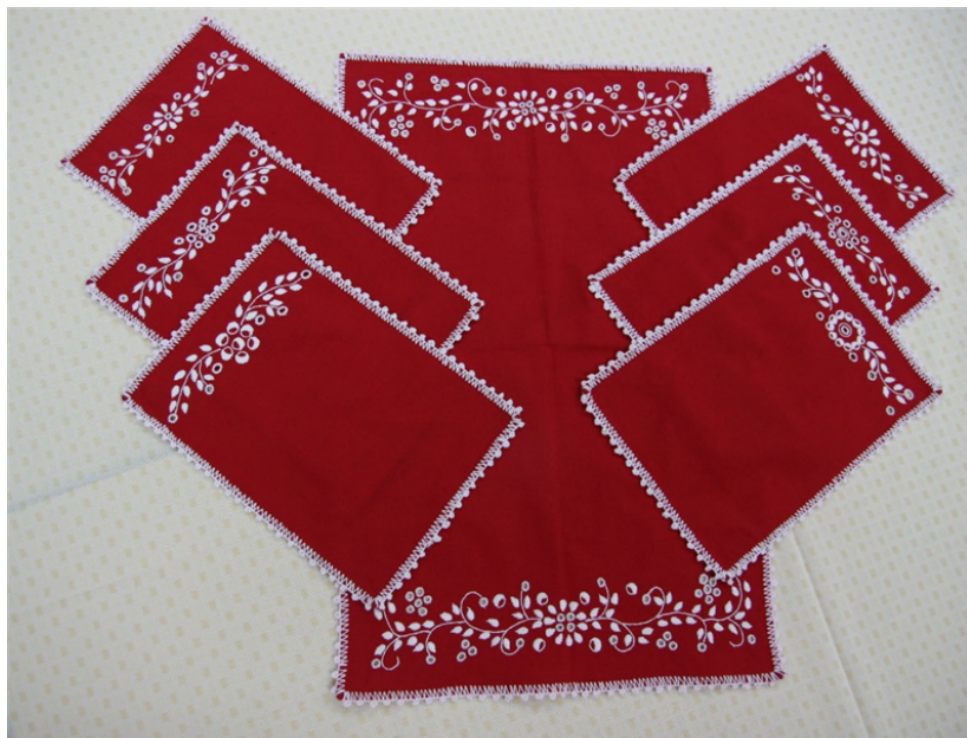
Rysunek 6. Przykład haftu kujawskiego