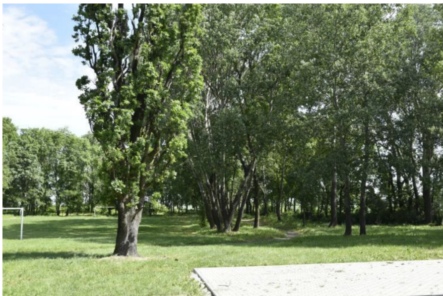
Rysunek 18. Park dworski w Skibinie