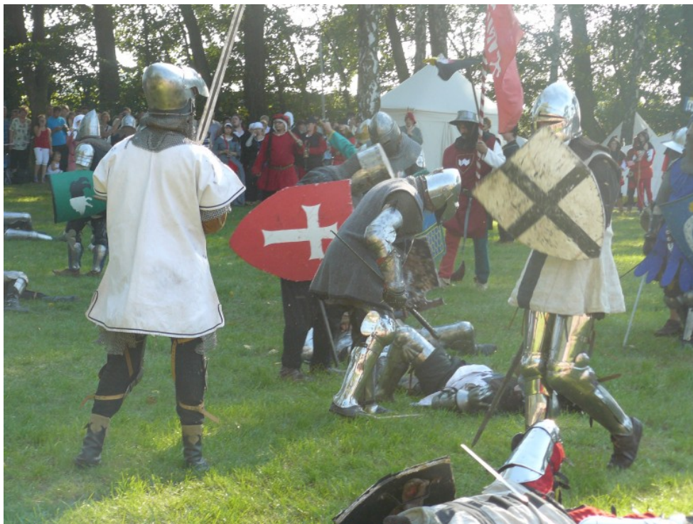
Rysunek 8. Inscenizacja bitwy pod Płowcami

W ramach inscenizacji odprawiana jest polowa msza święta, po której następuje odegranie bitwy pomiędzy rycerstwem polskim a krzyżackim, której wynikiem jest zwycięstwo wojsk polskich. Dodatkowo uroczystości towarzyszą m.in. pomniejsze potyczki rycerskie, koncerty muzyczne czy różnego rodzaju konkursy i wystawy.