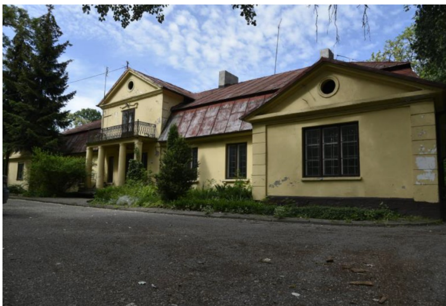
Rysunek 15. Dwór w Płowcach

Dwór jest obiektem parterowym, ceglany, otynkowany, wzniesionym na fundamencie z kamienia polnego, w stylu klasycystycznym, na planie wydłużonego prostokąta, kryty dachem czterospadowym mansardowym. W osiach skrajnych ryzality kryte dachem dwuspadowym o niższej poprzecznej kalenicy, natomiast w centrum ryzalit z piętrowym portykiem wspartym na czterech kolumnach, zwieńczonym trójkątnym przyczółkiem, kryty dachem dwuspadowym na poprzecznej kalenicy. Wystrój dekoracyjny ścian w tynku w postaci bonowanych naroży oraz opraw okiennych i drzwiowych (nadproża).