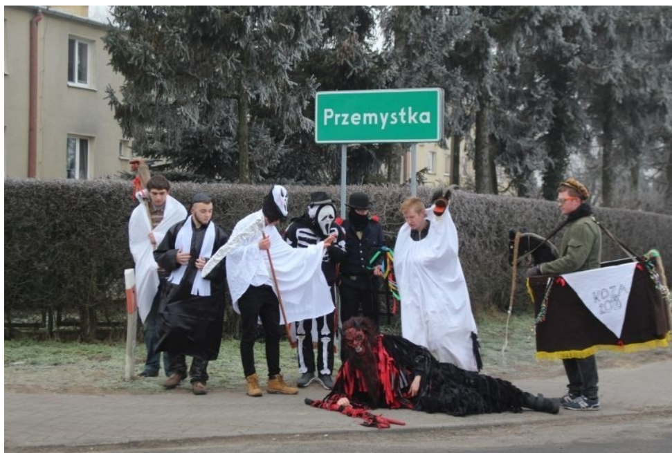
Rysunek 5. „Koza” w miejscowości Przemystka

Najpopularniejszym do dziś praktykowanym zwyczajem kujawskim na terenie gminy jest chodzenie z kozą (koza). Są to barwne korowody przebierańców z maskarami zwierzęcymi, symbolizującymi siły wegetacyjne (m.in. koza, niedźwiedź, koń, bocian oraz również śmierć, diabeł, kominiarz, młoda para), które spotkać możemy w ostatnim dniu karnawału. Dawniej wierzono, że wędrowki kołędników spowodują szybkie nadejście wiosny. Przemierzają oni miejscowości od domu do domu, gdzie odgrywają krótkie przedstawienie, po którym gospodarze obdarowują ich drobnymi darami (zazwyczaj słodkim poczęstunkiem i słodkościami lub symboliczną kwotą „na sianko dla kozy”).