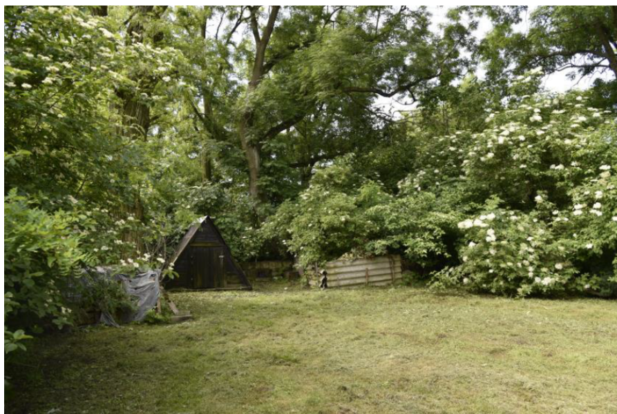
Rysunek 16. Park dworski w Płowcach