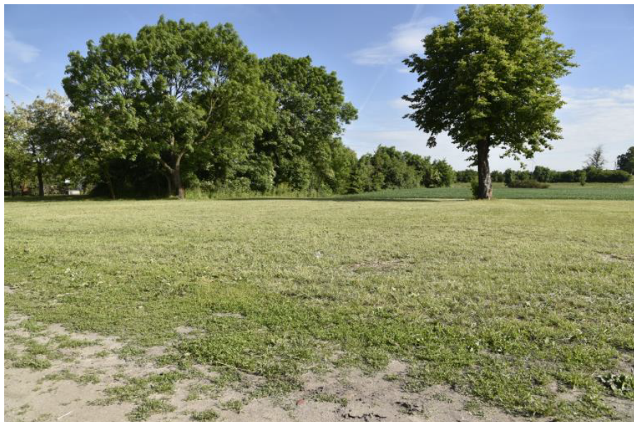
Rysunek 12. Park dworski w Broniewie

Drugi dworek z powodu złego stanu technicznego został rozebrany jeszcze przed II wojną światową.