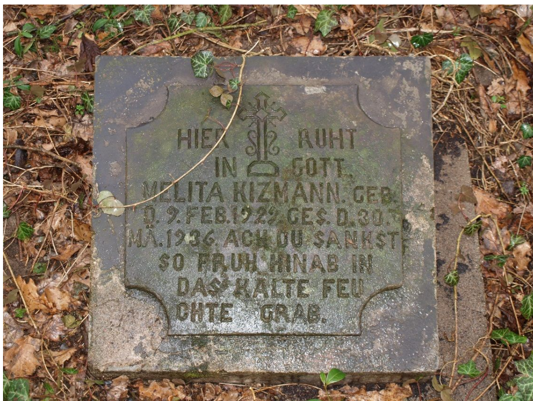
Fot. 3. Płyta nagrobna na cmentarzu ewangelickim w Sarnowie.

Na terenie gminy znajdują się także cmentarze ewangelickie, położone w miejscowościach: Siarczyce, Sarnowo, Lubraniec, etc.