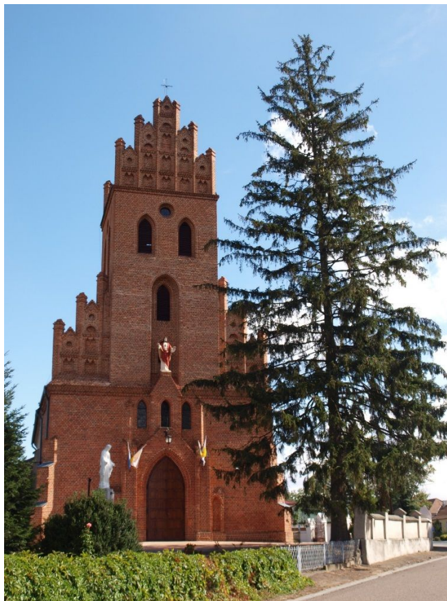
Fot. 6. Kościół pw. Narodzenia NMP.