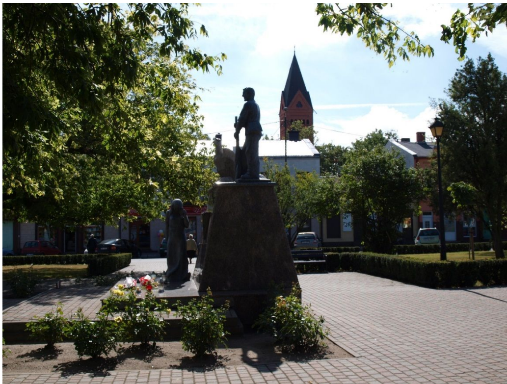
Fot. 8. Pomnik na rynku w Lubrańcu.