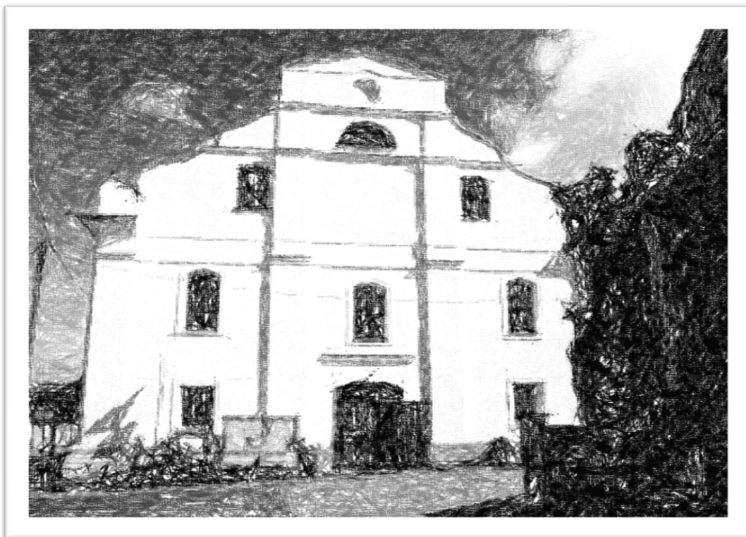
Fot. 1. Stylizowane zdjęcie dawnej synagogi w Lubrańcu

Niniejsze opracowanie zostało przygotowane przez: mgr Ewę Kubską– Oleksy Konsultacja merytoryczna: dr Marek Kołyszko mgr Michał Oleksy