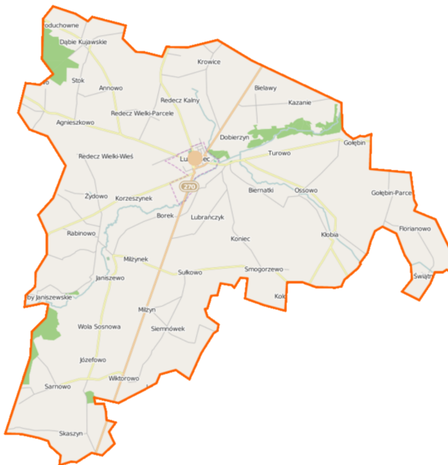
Ryc. 1. Mapa lokalizacyjna gminy Lubraniec.

Teren gminy w 88 % stanowią użytki rolne z przewagą gleb dobrych, a tylko w 4 % - użytki leśne. Wysokowartościowe gleby oraz tzw. uroczyska – o zróżnicowanym, bogatym w gatunki drzewostanie i wielowarstwowym układzie runa podszytu stanowią najcenniejsze bogactwa naturalne gminy. Kompleksy leśne znajdują się jedynie w okolicach Sarnowa i Dąbia Poduchownego.