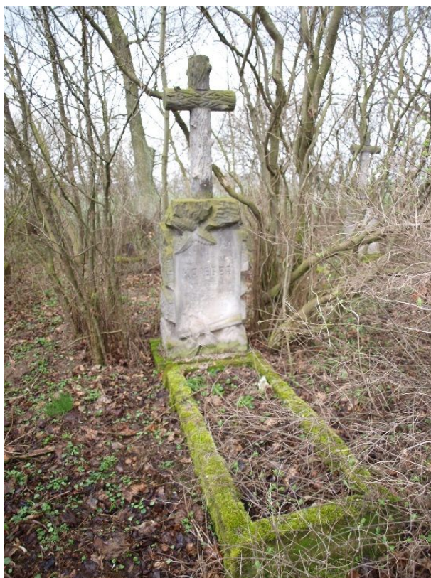
Fot. 7. Cmentarz ewangelicki w Siarczycach.