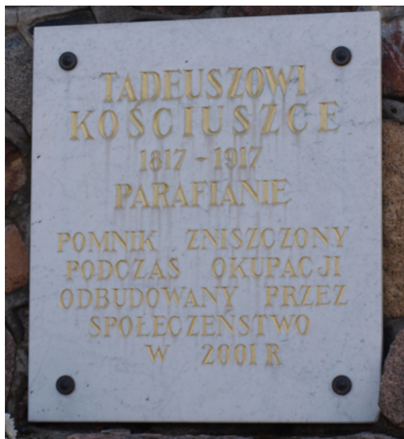
Fot. 5. Pomnik Tadeusza Kościuszki – tablica na cokole.