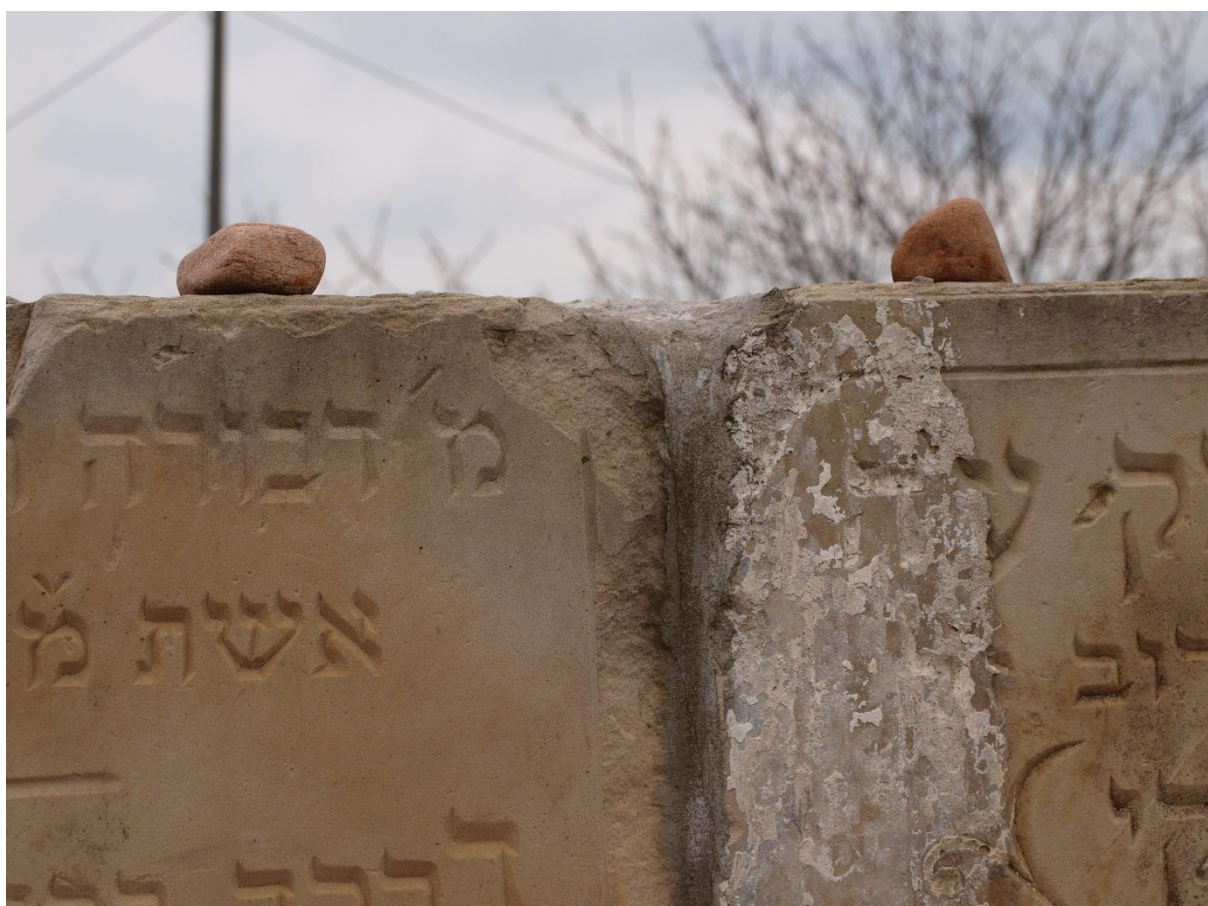
Fot. 9. Fragment pomnika powstałego z odzyskanych macew na terenie dawnego cmentarza żydowskiego.

Załącznik nr 1. Wykaz stanowisk archeologicznych na obszarze gminy i miasta Lubraniec, zlokalizowanych w trakcie badań powierzchniowych w ramach Archeologicznego Zdjęcia Polski (AZP) –źródło: WUOZ Włocławek.