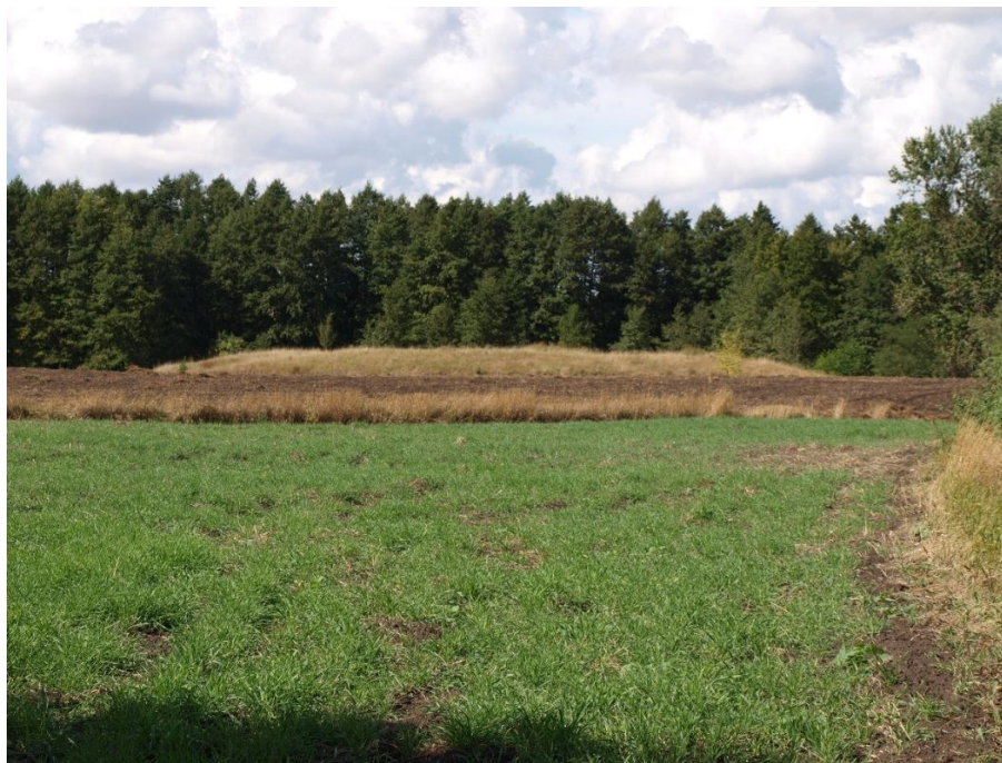
Fot. 2. Grodzisko średniowieczne w Zgłowiączce (fot. Ewa Kubska-Oleksy)