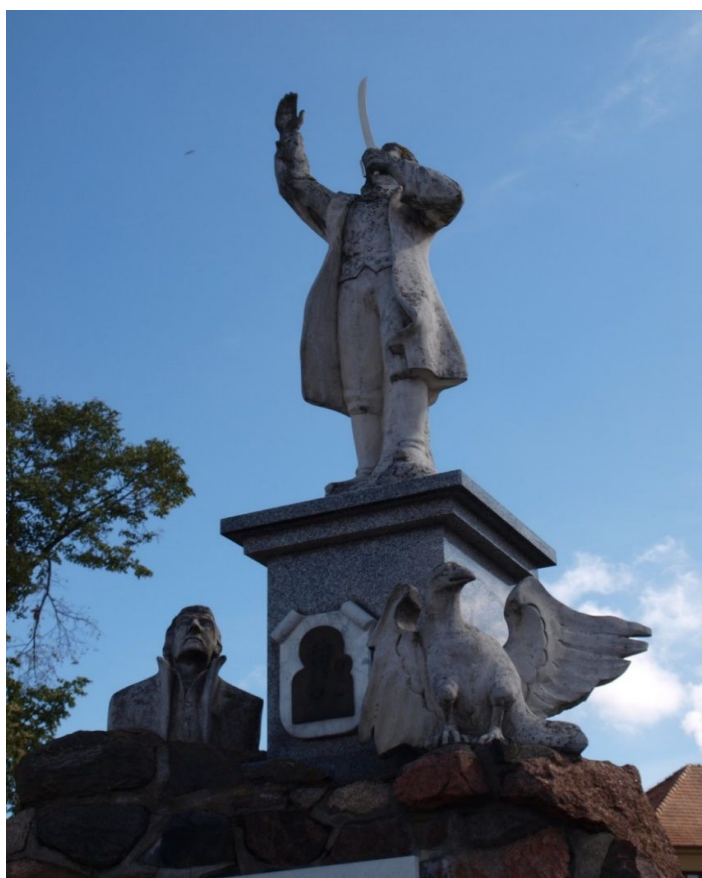
Fot. 4. Pomnik Tadeusza Kościuszki.

Na uwagę zasługuje pomnik Tadeusza Kościuszki stojący przy skrzyżowaniu dróg w Zgłowiączce, ufundowany w większości z zasobów Jadwigi i Stefana Borzymów w 1917 r.