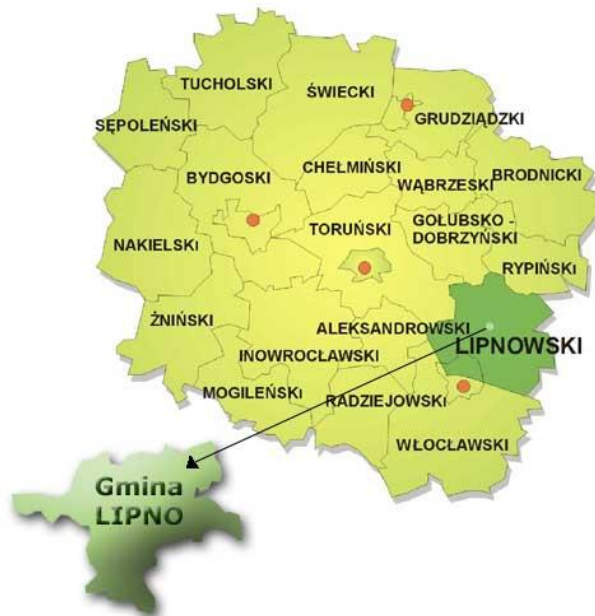
Położenie Gminy Lipno na tle województwa kujawsko-pomorskiego