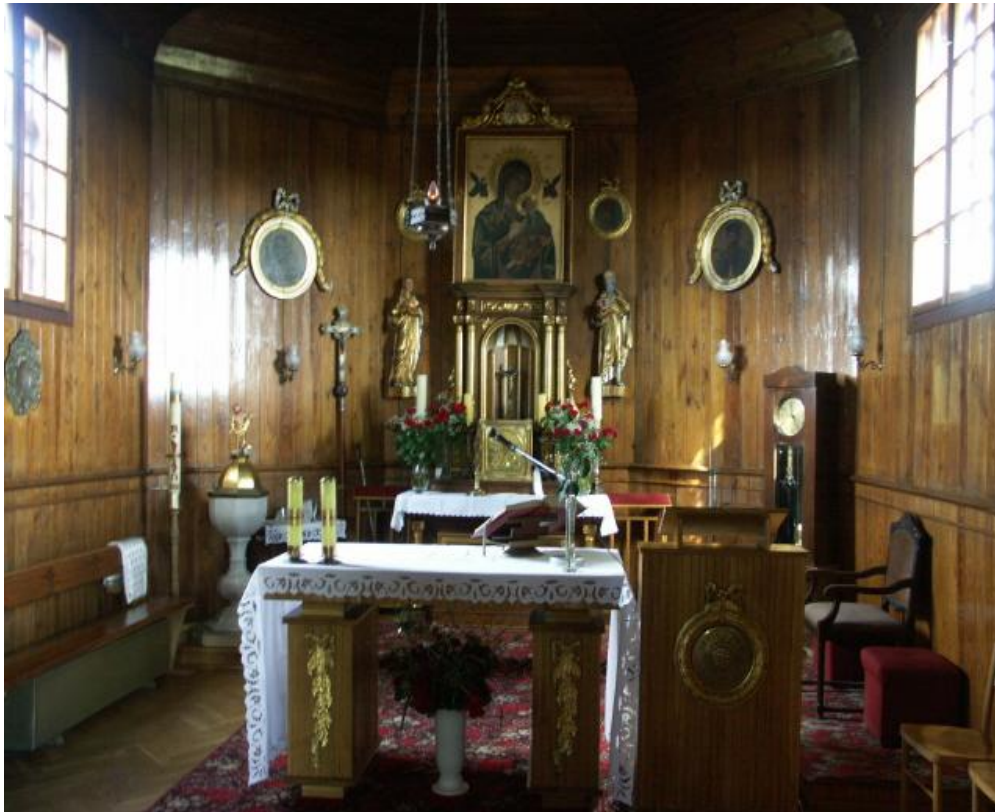
Wnętrze kościoła parafialnego w Ostrowitem

We wnętrzu styl jednolity i klasycystyczny. Znajdujący się tutaj ołtarz główny ze współczesnym obrazem Matki Bożej Nieustającej Pomocy, po konserwacji w Toruniu zyskał nową, złożoną ramę.