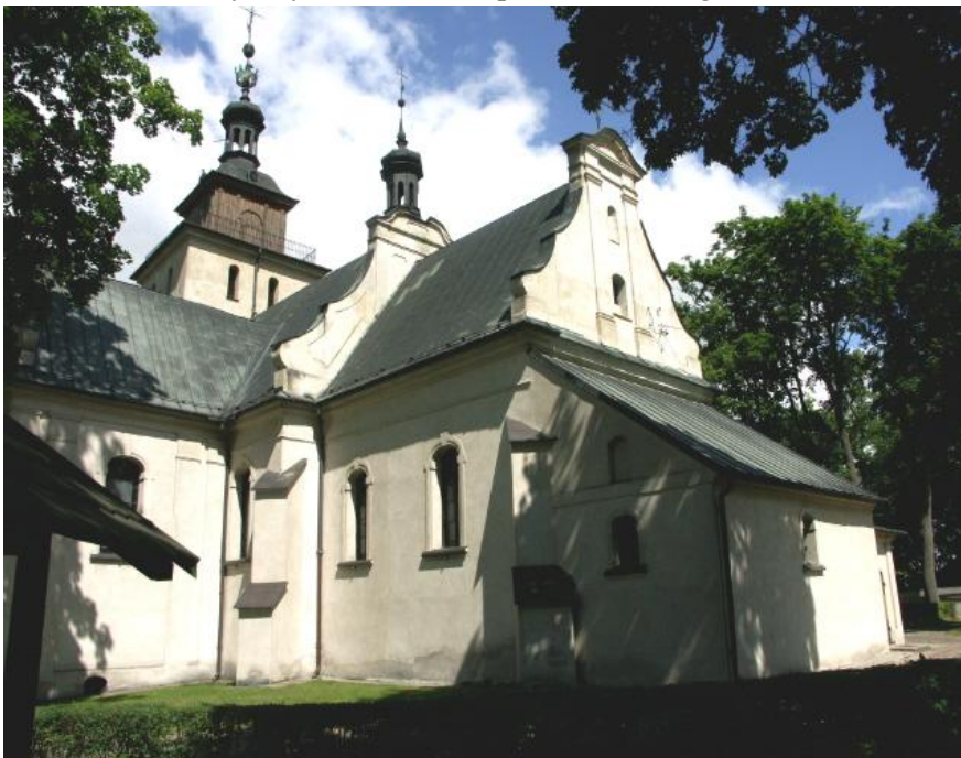
Kościół Parafialny p.w. św. Jadwigi w Karnkowie

zachodu z korpusem. Drewniana nadbudówka pokryta jest hełmem włoskim, baniastą kopułą oraz ośmiokątną