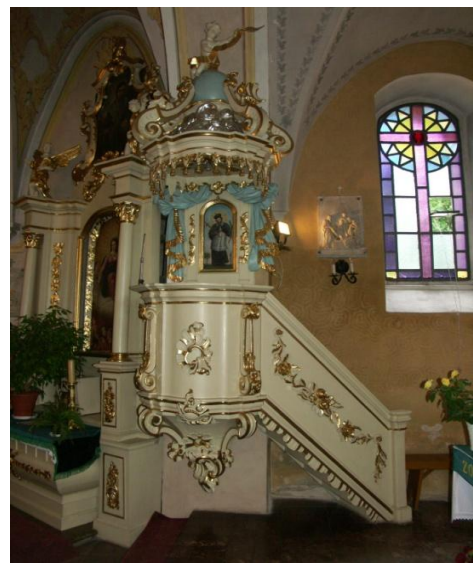
Wnętrze kościoła Parafialnego p.w. św. Jadwigi w Karnkowie

Dzięki dużej ilości okien, które są wysoko umieszczone, kościół jest jasny i dobrze oświetlony. W prezbiterium i nawie okna zdobią witraże.