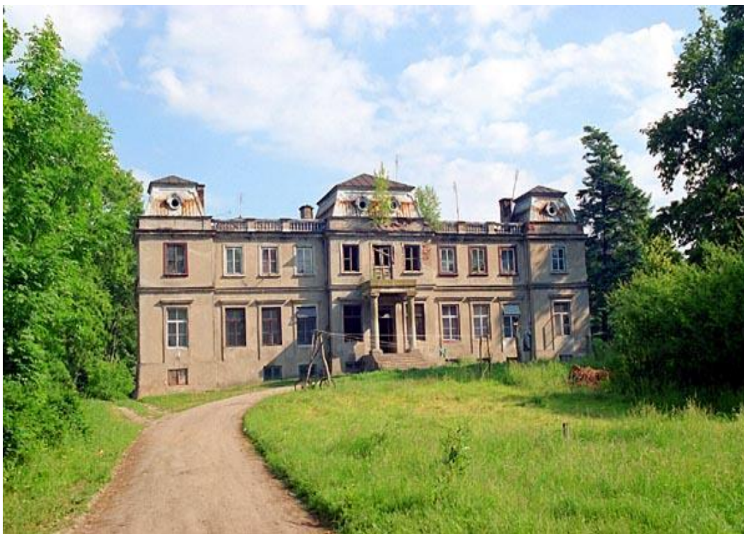
Elewacja frontowa dworu w Wierzbicku