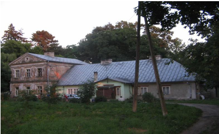
Zespół dworsko – pałacowy w Jastrzębiu

Dwór założony na rzucie litery "T", ustawionej osią podłużną w kierunku północ-południe. Starsza część budynku w kształcie wydłużonego prostokąta, nowsza również prostokątna, bardziej zwarta i krótka. Główne skrzydło dworu piętrowe, murowane w stylu klasycyzującym przylega do parterowego korpusu od strony wschodniej. Skrzydło nakrywa niski dwuspadowy dach, którego szczyty nad elewacją pn. i pld. tworzą trójkątne frontony z okulusami na osi. Dach pokryty jest blachą, elewacje skrzydła otynkowane, posadowiona na niskim cokole z odsadzką. Kondygnacje dzielone masywnym profilowanym gzymsem. W parterze podział ściany ramowy, a w kondygnacji piętra - pseudotoskańskimi pilastrami z głowicami (wspierają one pozorne belkowanie złożone z szerokiego fryzu i profilowanego gzymesu). Otwory okienne prostokątne w zarysowanych przez lizeny i pilastry płycinach.