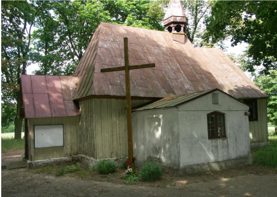
Widok kościoła parafialnego p. w. MB Częstochowskiej w Brzeźnie