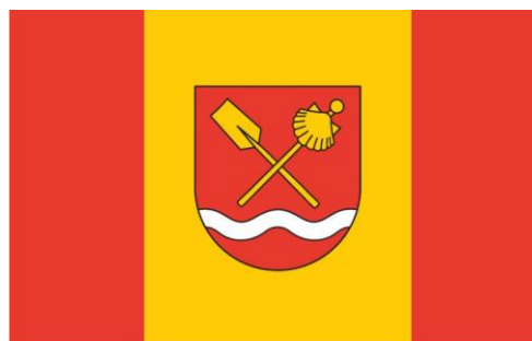
Flaga (układ pionowy)