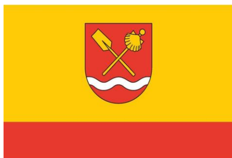
Flaga (układ poziomy)

Załącznik Nr 2 do Uchwały Nr XXXII/189/13 Rady Gminy Waganiec z dnia 11 listopada 2013 r.