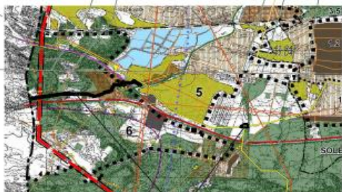
TERENY OBJĘTE MIEJSCOWYM PLANEM ZAGOSPODAROWANIA PRZESTRZENNEGO