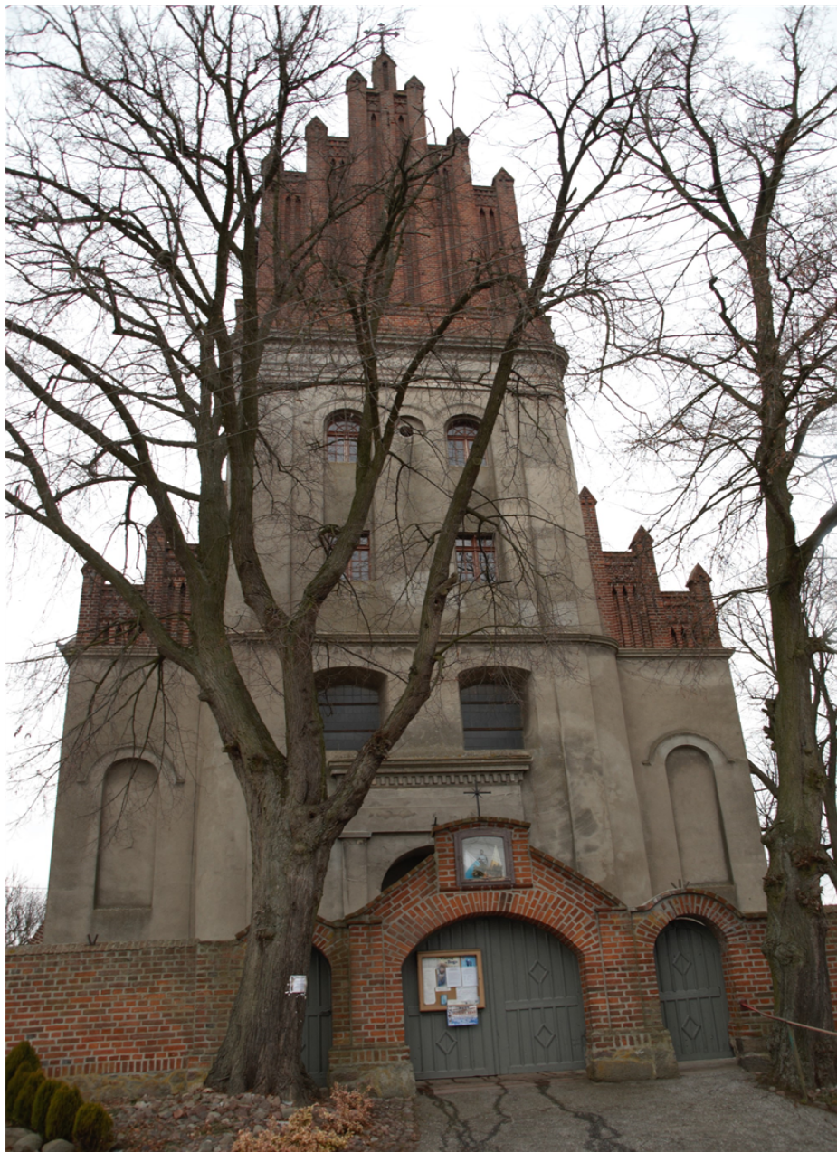
(Zespół klasztorny Zgromadzenia Sióstr Miłosierdzia św. Wincentego a Paulo w Bysławku)