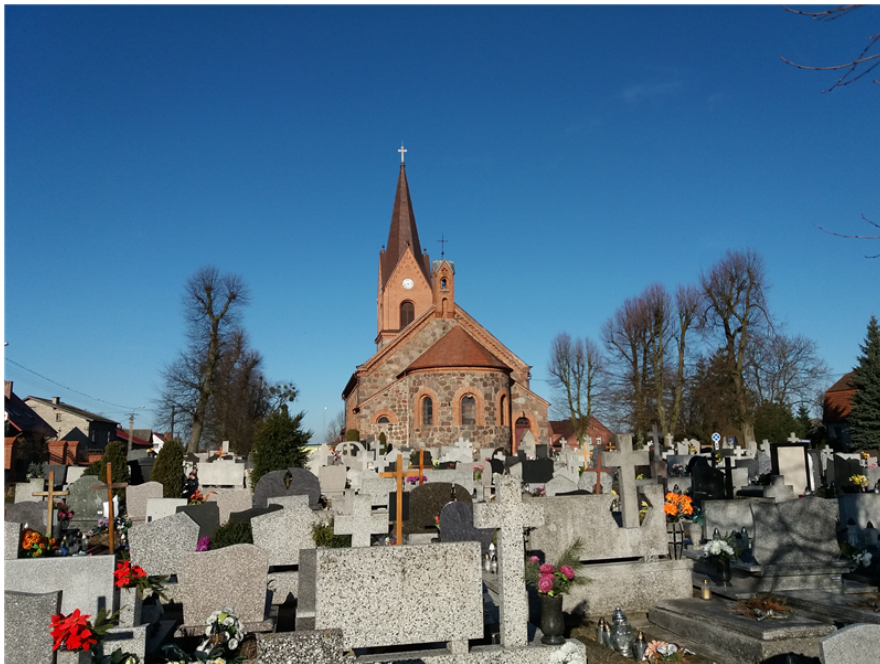
Kościół parafialny rzymskokatolicki p.w. św. Mikołaja w Lubiewie

krzyżem. Wieże wyposażono w cztery tarcze zegarowe oraz trzy dzwony o łącznej wadze ponad 1,5 tony. Wnętrze kościoła polichromowane ze scenami ukazującymi tajemnice różańca umiejscowionymi na balustradzie chóru. Wnęki, okna oraz arkada wydzielająca apsydę zamknięte półkuliście. Świątynia posiada trzy ołtarze: główny oraz dwa boczne. Główny pochodzący z II poł. XIX w. składa się z mensy oraz nastawy ołtarzowej wyposażonej w obraz Matki Bożej z Dzieciątkiem oflankowanej czterema kolumnami o korynckich głowicach. Nastawę ozdabiają dodatkowo dwie rzeźb – św. Wojciecha oraz św. Stanisława, pochodzące z poł. XVII w. Za obrazem głównym na zasuwie umieszczone zostały dwa kolejne obrazy, przedstawiające św. Wojciecha oraz św. Walentego, drugiego patrona parafii. Boczne ołtarze usytuowane zostały po południowej i północnej stronie nawy. Pierwszym jest przestrzeń i środowisko 24 ołtarz św. krzyża datowany na 1835 r., drugi natomiast poświęcony został św. Janowi Nepomucenowi” (Iwicki 2007).