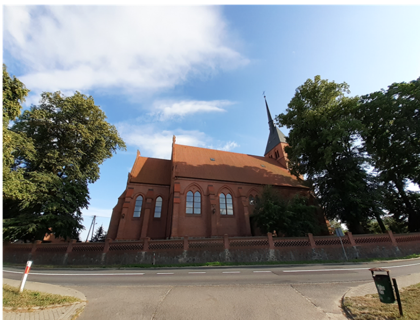
(Zespół kościoła p.w. Przemienienia Pańskiego w Bysławiu)

Zespół klasztorny Zgromadzenia Sióstr Miłosierdzia św. Wincentego a Paulo w Bysławku