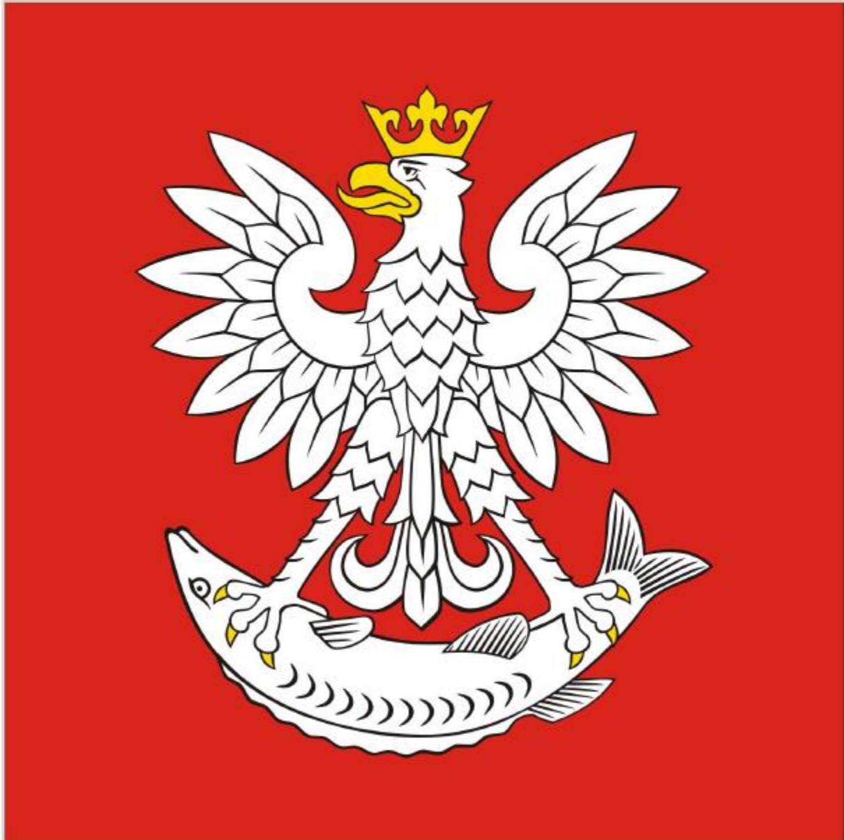
Chorągiew Miasta Nieszawa

Załącznik Nr 4 do Uchwały NR XXVII-177/17 Rady Miejskiej Nieszawa z dnia 30 listopada 2017 r.