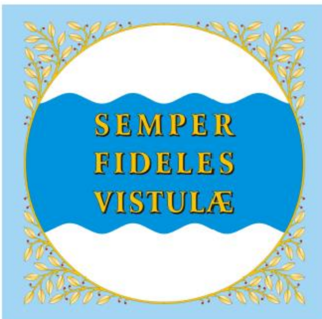
Sztandar Miasta Nieszawa rewers