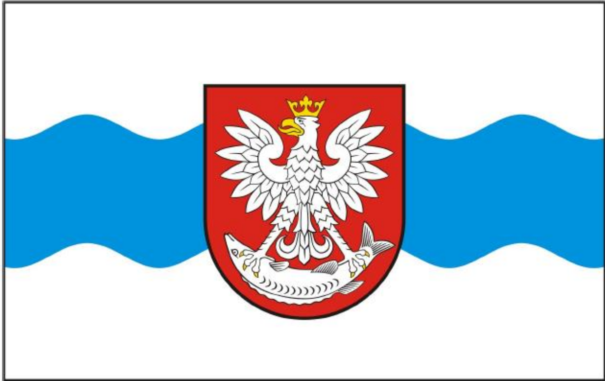
Flaga Miasta Nieszawa

Załącznik Nr 3 do Uchwały NR XXVII-177/17 Rady Miejskiej Nieszawa z dnia 30 listopada 2017 r.