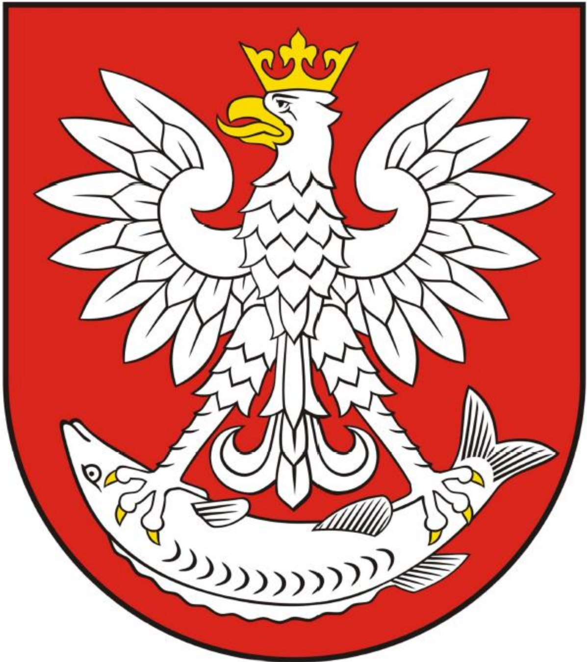
Herb Miasta Nieszawa

Załącznik Nr 1 do Uchwały NR XXVII-177/17 Rady Miejskiej Nieszawa z dnia 30 listopada 2017 r.